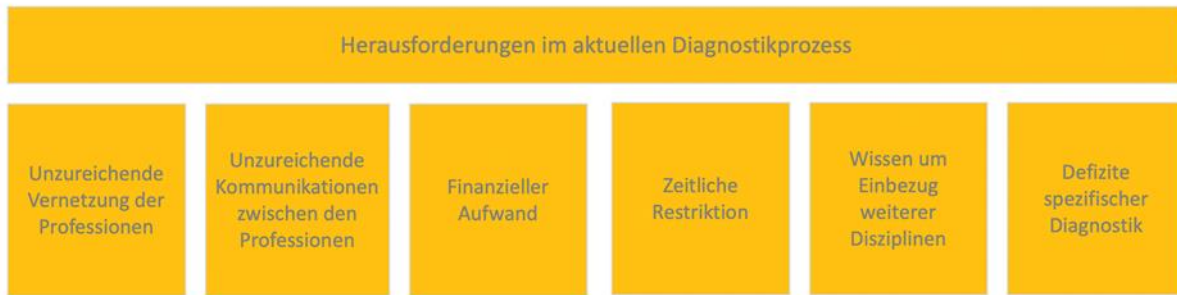
Abbildung 3: Zusammenfassende Darstellung der aktuellen Herausforderungen im Diagnostikprozess von SHT-PatientInnen