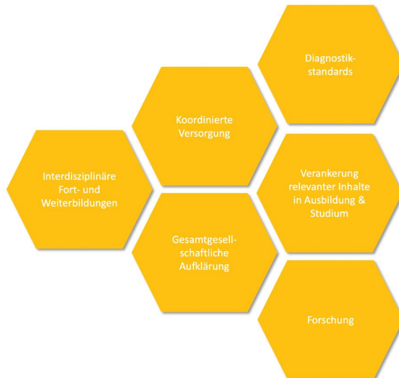
Abbildung 4 praktische Implikationen aus Sicht der ExpertInnen