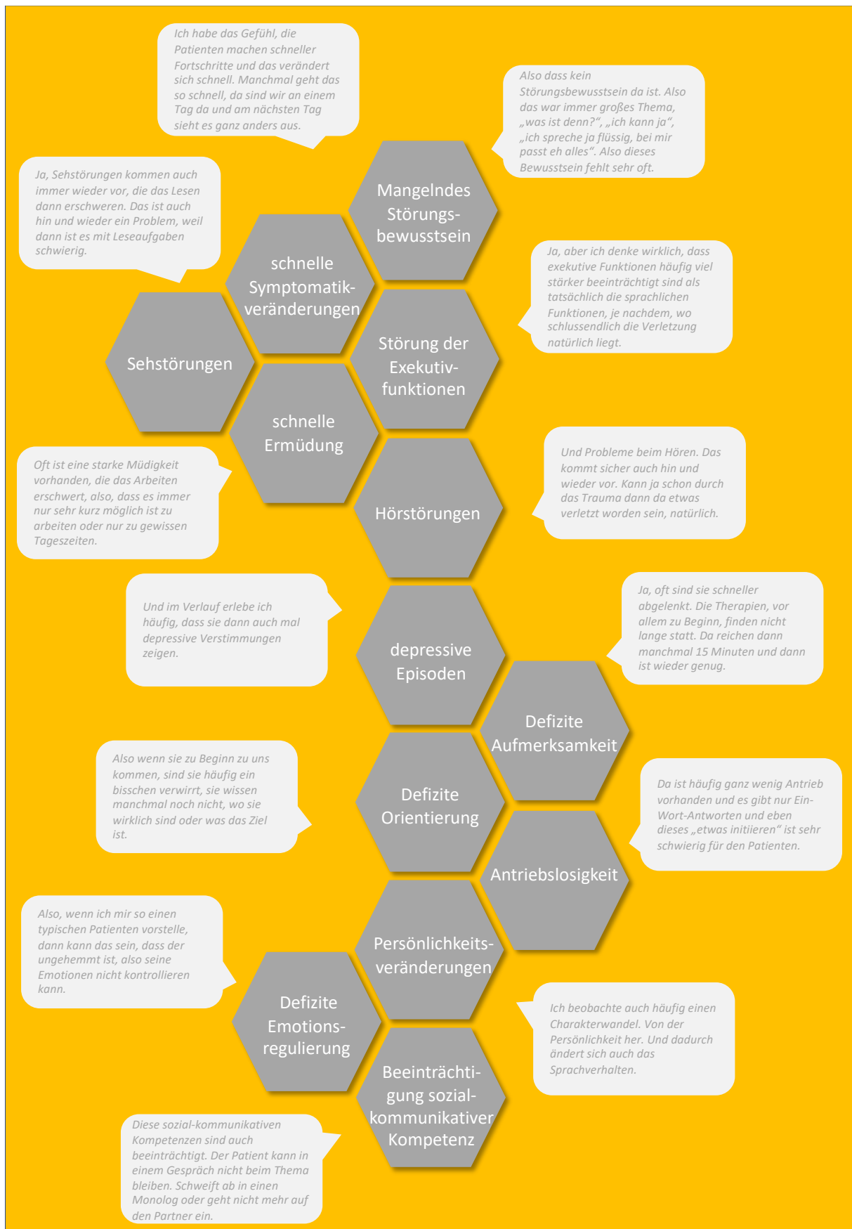
Abbildung 2: Typischer Symptomkomplex von SHT-PatientInnen aus Sicht der Versorgenden